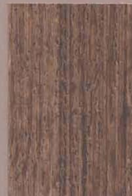
5069 Siimes 2