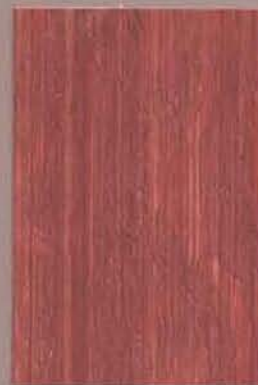
5058 Varvikko 3