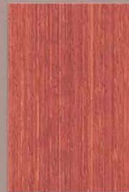
5056 Kettu 2