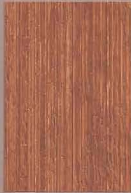
5071 Tatti 2