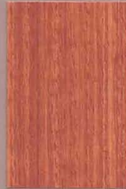
5055 Mänty 2