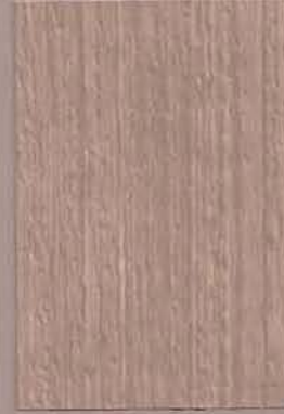
5083 Kivi 2