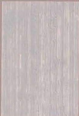
5084 Kajo 3