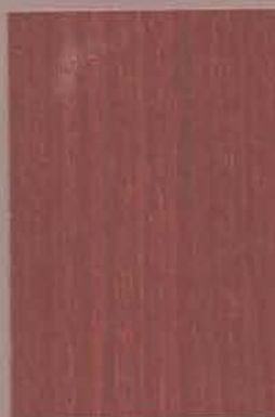
5057 Orava 2