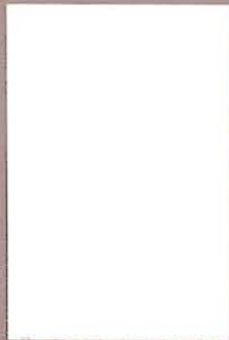
5060 Lumi 3