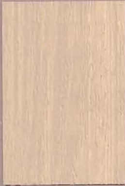
5080 Vasa 3