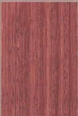
5075 Kihokki 2