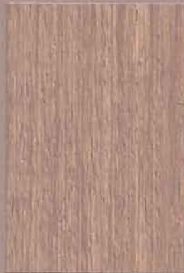
5087 Poro 2