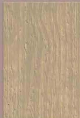
5065 Suvu 3