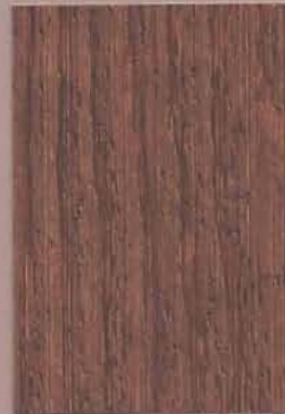
5077 Kanta 2