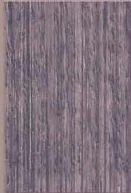
5085 Ilta 3