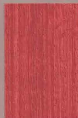
5059 Marja 2