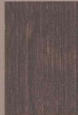
5088 Turve 2