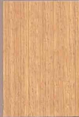
5064 Heinä 2