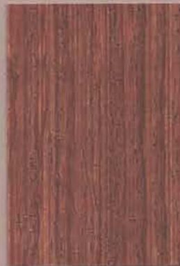
5073 Petäjä 2