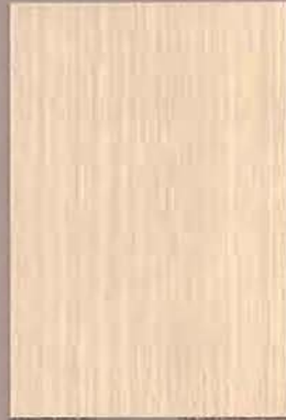
5061 Kaisla 3