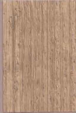
5082 Laavu 2