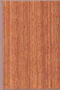
5052 Pouta 2