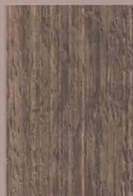
5078 Kataja 2