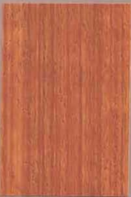
5053 Vahvero 2