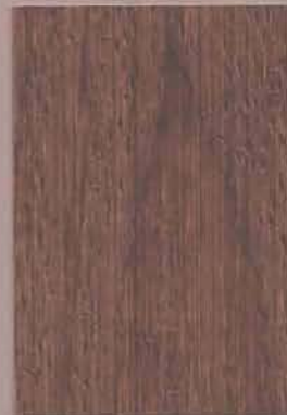
5074 Karhu 2