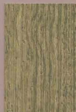
5066 Lehti 2