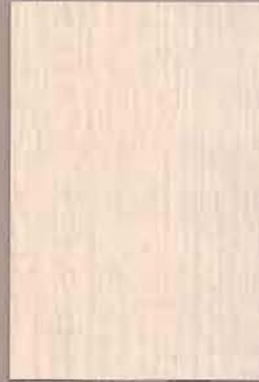
5062 Tuohi 3