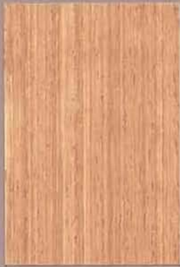
5063 Sora 2