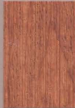
5072 Honka 2