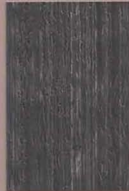
5086 Yö 2