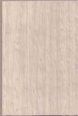
5081 Kaste 3