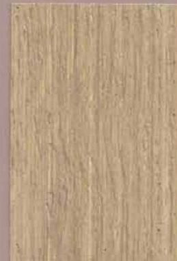
5068 Näre 2