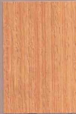
5051 Pihka 2