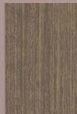
5067 Lieko 3