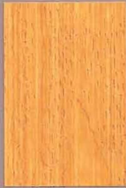
5050 Mesi 2