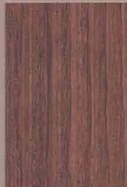
5076 Varpu 2