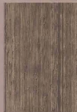
5079 Kuusi 2

3. Lopulliseen väriin vaikuttavat puun laatu, karkeus ja huokoisuus, levityspaksuus sekä käytetty puunsuoja-aine. • Träets beskaffenhet, ytans grovhet och porositet, skiktjockleken samt den använda träslasyren inverkar på den slutliga kulören. • The final colour depends on the type and amount of the wood finish as well as the roughness, quality and porosity of the wood surface.