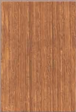
5070 Ruoko 2