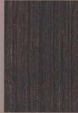
5089 Piki 2