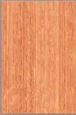
5054 Kantarelli 2