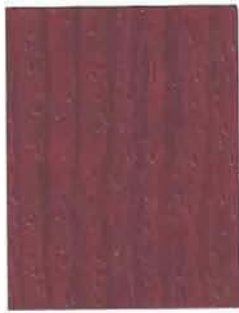
3461 Kriikuna / Krikon / Plum