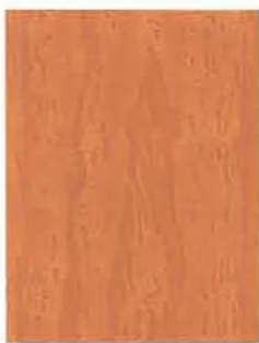
3448 Pyökkipuu / Bokträ / Beech EP/2