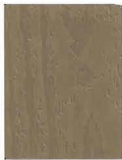
3453 Muratti / Murgroņa / Ivy