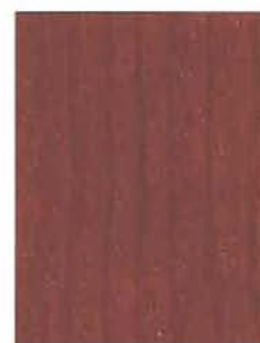
3451 Jalopuu / Ädelträ / Mahogany EP/3

Nämä värimallit on sivelty kahteen kertaan puolikiiltävällä Kiva Kalustelakalla. • Kulörmodellerna är gjorda med två strykningar halvblank Kiva Möbellack. 2. Värit ovat These colour samples represent two coats of semi-gloss Kiva Furniture Lacquer. Colours a