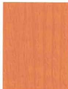
3447 Koripaju / Korgvide / Willow EP/2