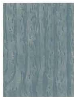
3454 Välimeri / Medelhavet / Mediterranean