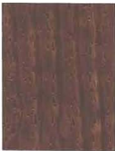
3444 Mustamarja / Svartbär / Blackberry EP/2