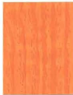
3458 Mandariini / Mandarin / Tangerine