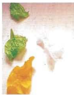
3457 Kesäpäivä / Sommardag / Summerday