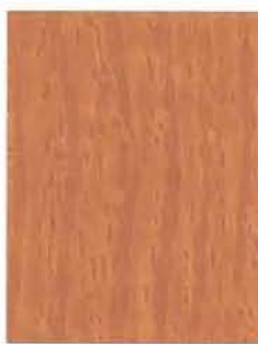
3441 Pähkinäpensas / Hasselbuske / Hazel EP/2