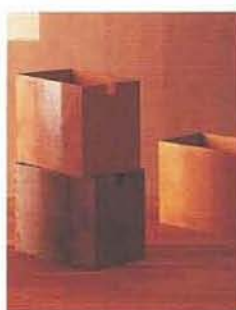
3446 Aarnihonka / Jätrefura / Redwood EP/1