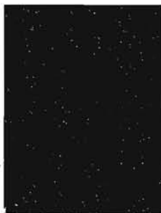
3445 Hiili / Kol / Charcoal EP/2