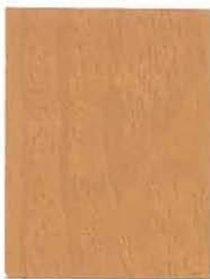
3440 Vanha tammi / Antikek / Old Oak EP/2