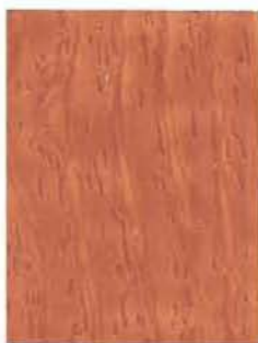
3449 Sydänpuu / Kärnved / Heartwood EP/2