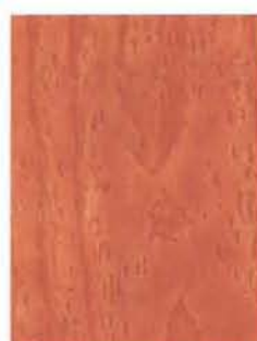
3450 Nougat EP/2