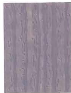
3455 Meri / Hav / Sea