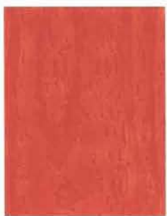
3459 Pihlajamarja / Rönnbär / Rowanberry