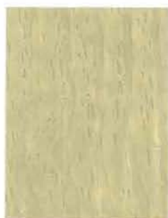
3452 Lehto / Lund / Grove