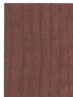
3443 Wenge / Wenge EP/2