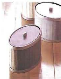
3468 Roosa / Rosa / Rose