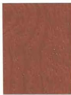
3442 Tiikkimetsä / Teakskog / Teak EP/2